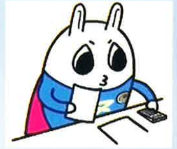
東京地方税理士会 イメージキャラクターの「トッチーくん」