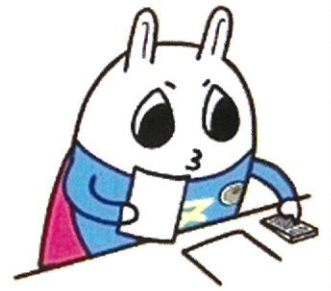
東京地方税理士会 イメージキャラクターの「トッチーくん」