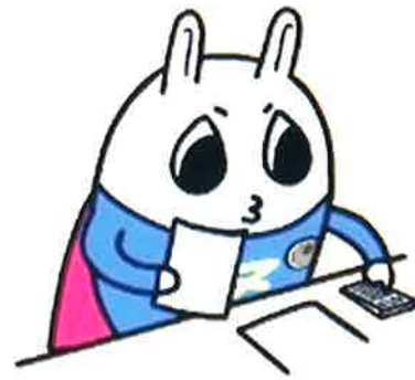
東京地方税理士会 イメージキャラクターの「トッチーくん」